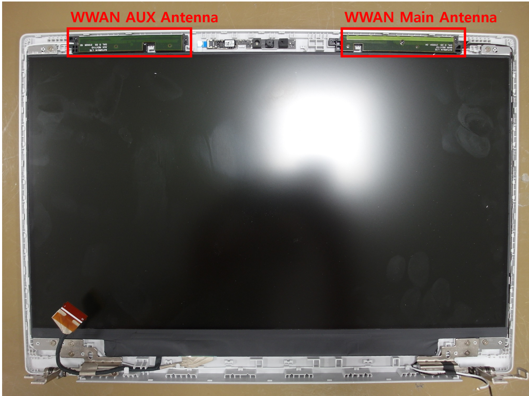
WWAN Main Antenna