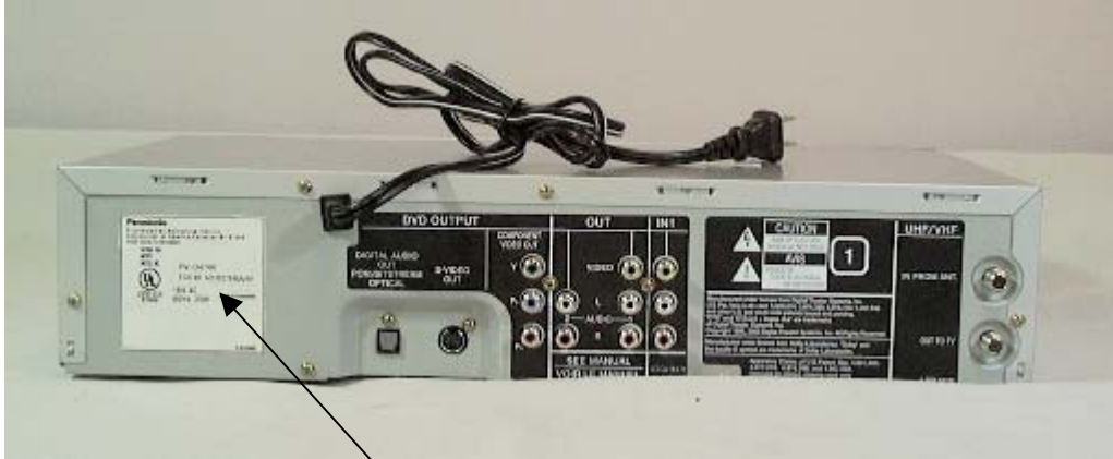
Nameplate with FCC Identifier