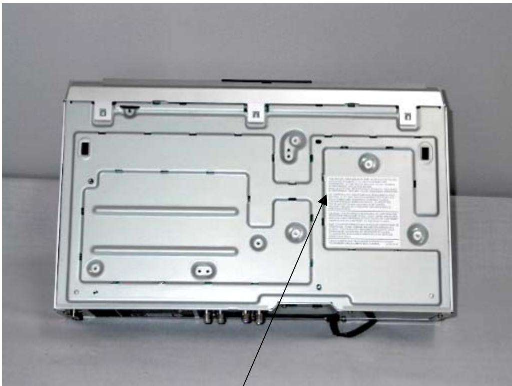
Statement for Compliance with FCC Rules Part 15