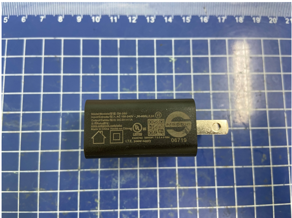
CH-35U tianyin pic2