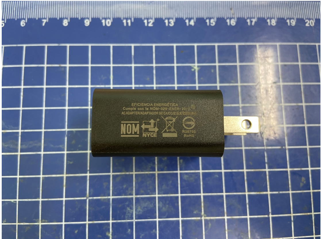
CH-35U tianyin pic1