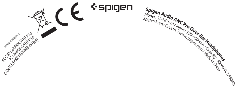
QCYH3（SPIGEN）黑色通用版左侧支叉下壳镭雕图档 Chart File